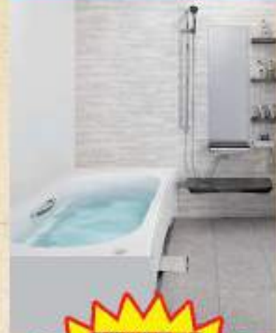
タカラ グランスパ フロアこだわりプラン