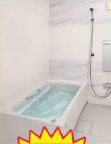
タカラ グランスパ ベーシックプラン

こんな問題は「高断熱浴槽」に交換すると即解決します。シャワーも節水タイプのものが多く、水道代も節約できます。